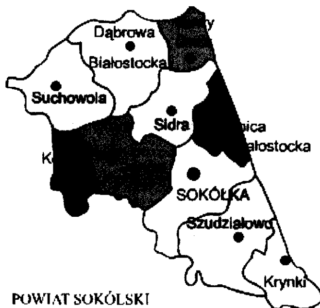
(położenie Gminy Sokółka w powiecie sokólskim)

Miasto jest siedzibą władz powiatu sokólskiego oraz instytucji rejonowych i powiatowych obejmujących swoim zasięgiem 10 okolicznych gmin. Powierzchnia gminy wynosi 313 km 2 i stanowi 15,3% powierzchni powiatu sokólskiego oraz 1,6% powierzchni województwa podlaskiego.